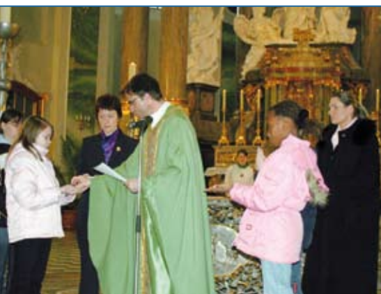
Salbung der Kinder mit dem Katechumenenöl im Sonntagsgottesdienst der Jesuitenkirche.

Katechumenaler Weg in der Erstkommunion-Vorbereitung