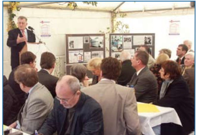
Erwin Teufel bei der Festansprache im Fairkauf-Festzelt.

Schließlich seien die Mannheimer „unkompliziert“, besonders auf dem Waldhof. In seiner Festrede lobte er Initiativen wie das Secondhand-Kaufhaus: „Es ist gut, dass es Menschen gibt, die hinschauen und helfen.“ Auch die Erste Mannheimer Bürgermeisterin Mechthild Fürst-Diery unterstrich im Grußwort den Stellenwert des Fairkauf-Hauses: „Hier sieht man, dass es notwendig und möglich ist, Langzeitarbeitslose und behinderte Menschen wieder ins Arbeitsleben zu integrieren.“ Vor den Feierlichkeiten im Festzelt auf dem Fairkauf-Parkplatz feierten die Gäste mit Monsignore Horst