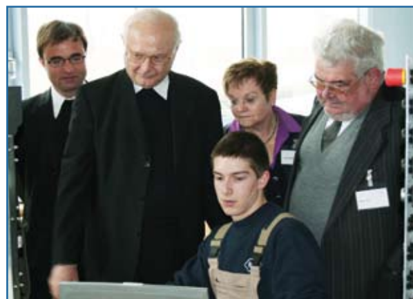
Erzbischof Zollitsch und seine Begleiterinnen und Begleiter schauten den Roche-Azubis über die Schulter.

Die Förderung von Jugendlichen in Schule und Ausbildung lag dem Freiburger Erzbischof auch bei einem Gespräch in der Arbeitsagentur Mannheim am Herzen. Hier ging es vor allem um die Auswirkungen und Probleme der Hartz-Gesetzgebung. Robert Zollitsch richtete aber auch das