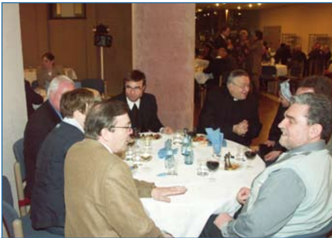
Treffen in der Jüdischen Gemeinde: Mannheimer Dekanatsratsmitglieder und Kardinal Lehmann.

Beim folgenden Abendessen in den Räumen der Jüdischen Gemeinde kam es zu einer zwanglosen Begegnung zwischen Kardinal Lehmann, dem Vorstand des Mannheimer Dekanatsrates und weiteren Mitgliedern des Gremiums. mat