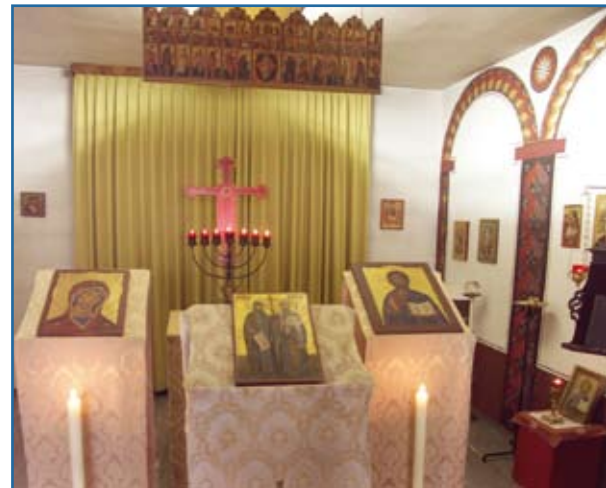
Die Kapelle des Ökumenischen Zentrums „Kyrill und Methodius“ in Neuostheim.

Wie sieht dieser Beitrag aus? Mittelpunkt im Leben der Orthodoxie ist der Gottesdienst. Das Zentrum gibt den hiesigen Christen Gelegenheit, in verschiedenen liturgischen Feiern etwas vom Geist östlicher Frömmigkeit mitzuerleben. So feiern wir in unserer ostkirchlichen Kapelle jeden Mittwoch die Göttliche