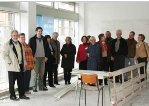
Am Rande des Schultages wurde auch das künftige Arbeitsumfeld begutachtet – das Haus der Kirche, derzeit noch Baustelle.

Ein Team von Freiwilligen bereitet sich auf die Aufgaben in der Citypastoral vor / Mehrtägiger Schulungskurs