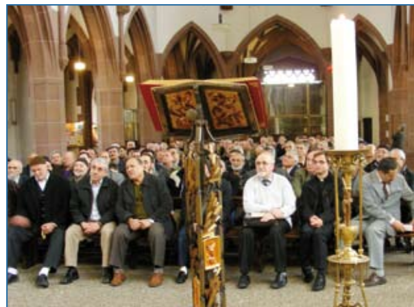
Unerwartet viele Muslime folgen der Einladung nach Liebfrauen.

Der Imam der Moschee-Gemeinde dankte für den herzlichen Empfang und appellierte in eindrucksvollen Worten an die Verpflichtung der Religionen für Gerechtigkeit und Frieden in der Welt. Als Geschenk überreichte er seinerseits das heilige Buch der Muslime, eine prachtvolle Ausgabe des Korans. Mit dem rezitativen Gesang der 1. Sure des Korans schloss er seine Ansprache. Wir Christen ant-