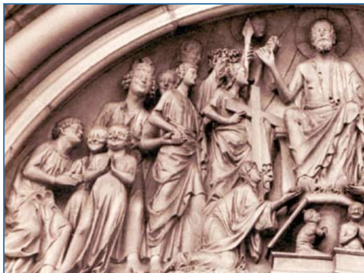
Fürstenportal am Bamberger Dom: Das Lachen der Seligen (Lukas 6,21).

Worum es eigentlich geht, mag die folgende Geschichte bezeugen, ein mich tiefbewegendes Erlebnis aus der Zeit des Studiums: Unser Professor für Dogmatik hatte einen Studienfreund und mich zu sich nach Hause eingeladen, um eine gemeinsame Arbeit zu besprechen. Er wohnte als Hausgeistlicher bei einem Schwesternkonvent in einem ländlichen Vorort der Universitätsstadt. Es war die Zeit nach Ostern, die Natur war erwacht;