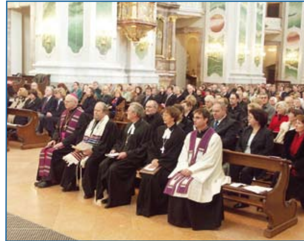
Jüdisch-christliche Gemeinschaftsfeier in der Jesuitenkirche